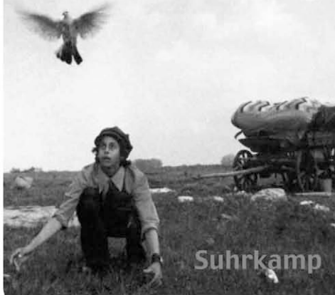
Klaus-Michael Bogdal: Europa erfindet die Zigeuner (Suhrkamp)

Klaus-Michael Bogdal Eine Geschichte von Faszination und Verachtung